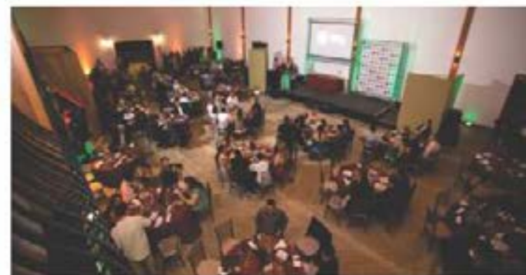
EM 2021 o Prêmio MM ensaiou uma volta ao presencial e foi um sucesso

lidade, Laundromat, Pizzaria Maracanã, Curimbaba, Tattoo Anjos, Central de Certidões, Cervejaria Gonçalves, Start Outdoor e Instituto Vacinar.