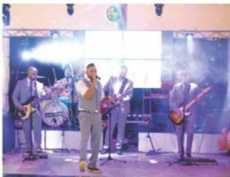
BANDA Aquarius a grande atração do baile de gala do Prêmio MM 30 Anos

Para mais informações de participação e patrocínio, inclusões ou exclusões de empresas da lista da pesquisa entre em contato e fale com Helena pelo 3697 1551 ou pelo e-mail: coordenacao@gsceventos.com.br