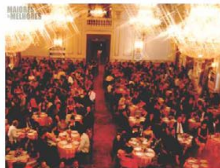
O PRÊMIO Maiores & Melhores tem uma história de 30 anos ininterruptos de valorização do empresariado poços-caldense e regional