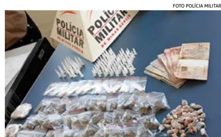
DROGA era vendida por adolescente na avenida Fosco Pardini, bairro São José