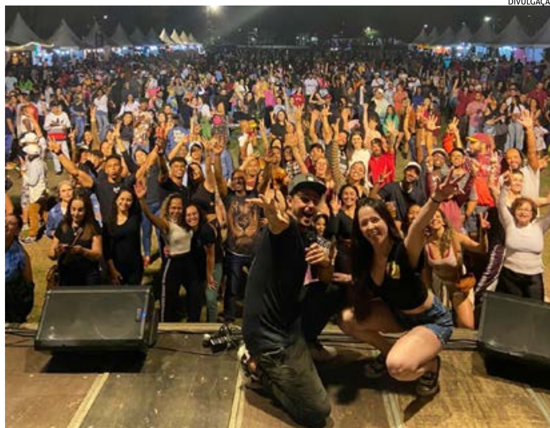
AULÃO com o "Esquadrão da Dança" foi uma das atrações da Festa do Esporte

Apesar do dia frio e nublado na sexta-feira, a festa prosseguiu com grande público no final de semana, aproveitando os dois dias de sol com poucas nuvens e a temperatura mais amena, especialmente domingo. A secretária interina de Es-