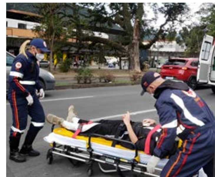
PILOTO e passageiro da moto foram socorridos pelo Samu e levados para a Santa Casa