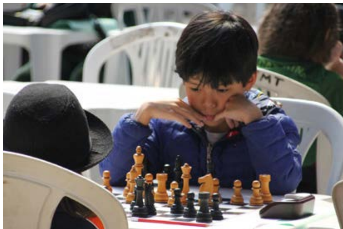
COMPETIÇÃO movimentou Poços de Caldas nos últimos dias