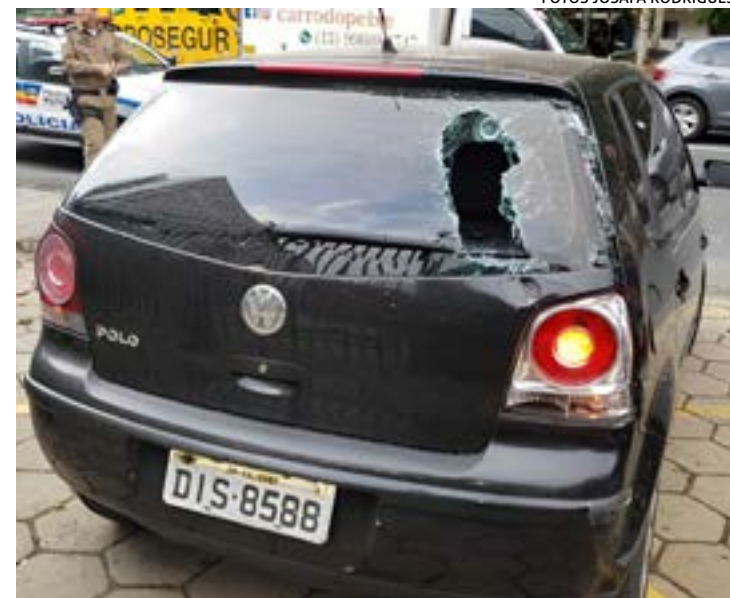
POLO Teve a traseira atingida pela moto