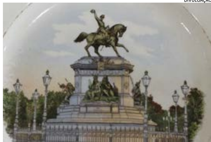
"SESMARIAS NAS CALDAS - Em tempos de Independência", que pode ser visitada a partir desta terça-feira

Embora a cidade tenha nascido oficialmente em 1872, ou seja, 50 anos depois da proclamação da independência de Por-