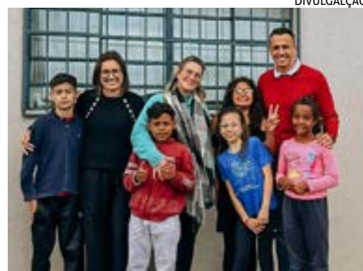
PRESIDENTE da Câmara fez uma visita à entidade a fim de conhecer de perto os projetos e o trabalho desenvolvido pelos profissionais