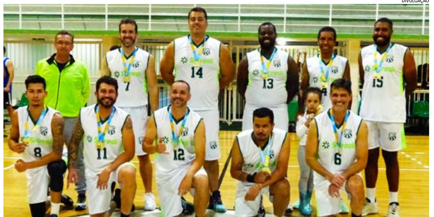
EQUIPE da Caldense, campeã do basquete da Olimpíada dos Trabalhadores

O placar final refletiu a superioridade da Caldense em quadra, com um resultado expressivo de 94 a 29 a seu favor.