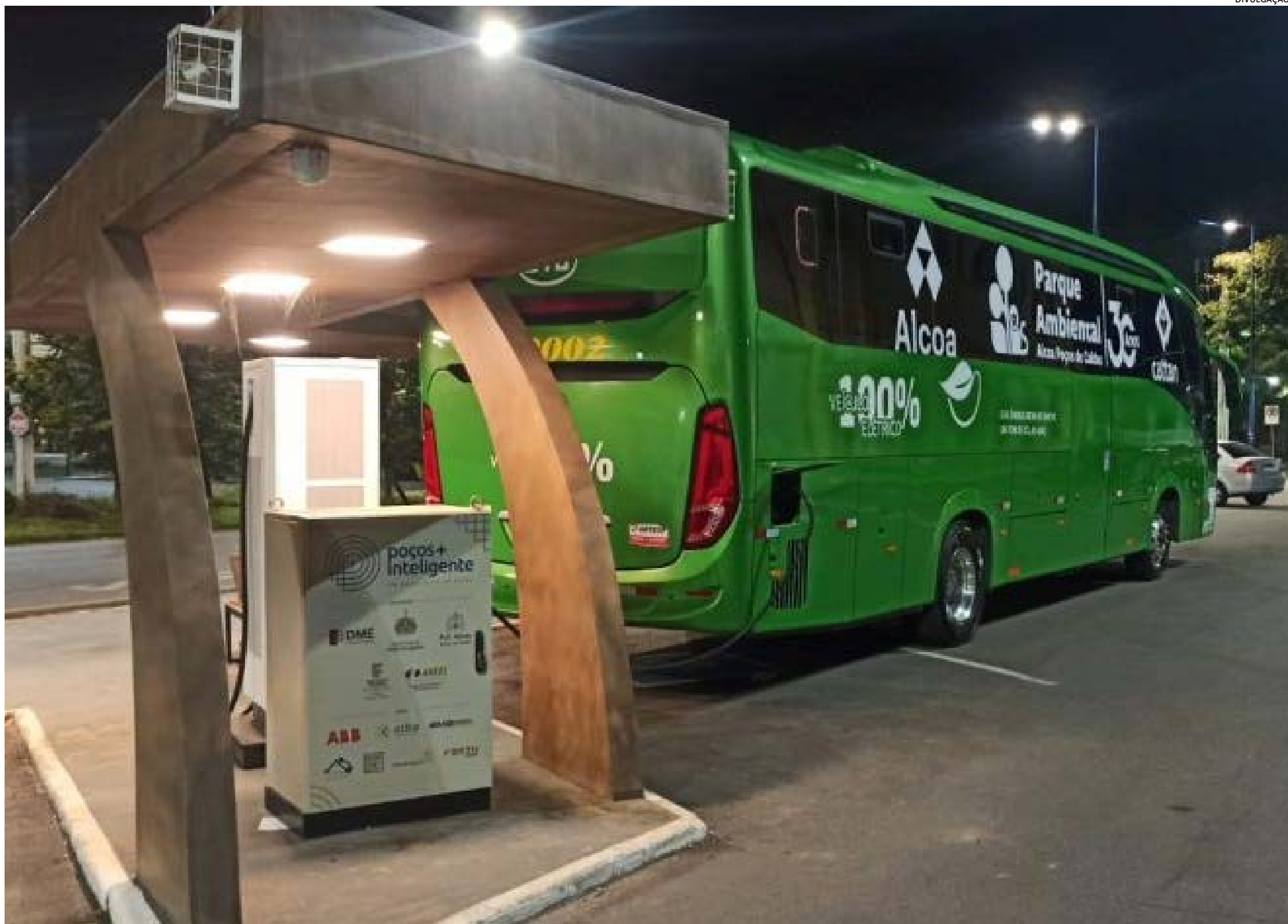
ÔNIBUS elétrico da Alcoa faz abastecimento regular na Estação Mogiana/Fepasa