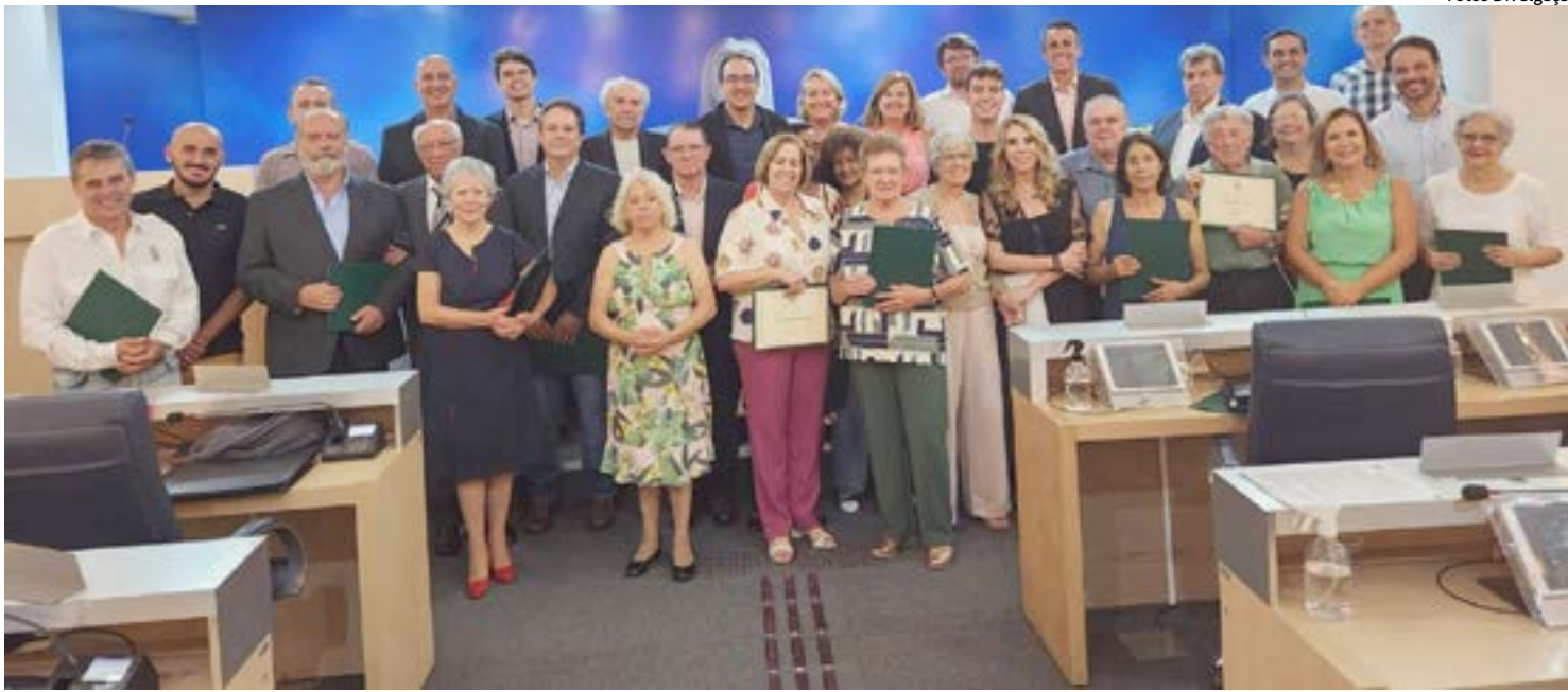
VÁRIAS pessoas que fizeram e fazem parte da história do hospital foram lembradas e receberam uma homenagem dos vereadores