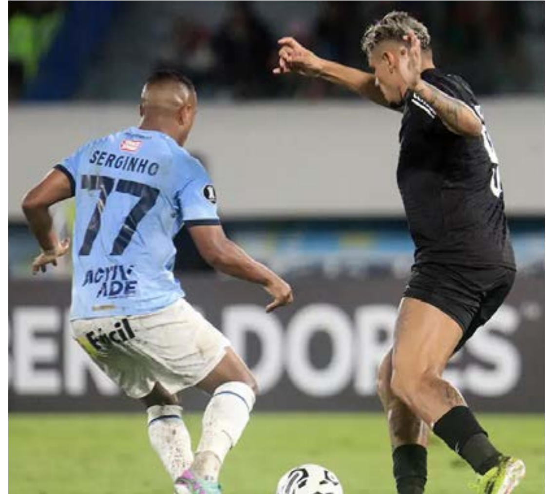
DECISÃO ficou para a próxima quarta-feira, no Nilton Santos