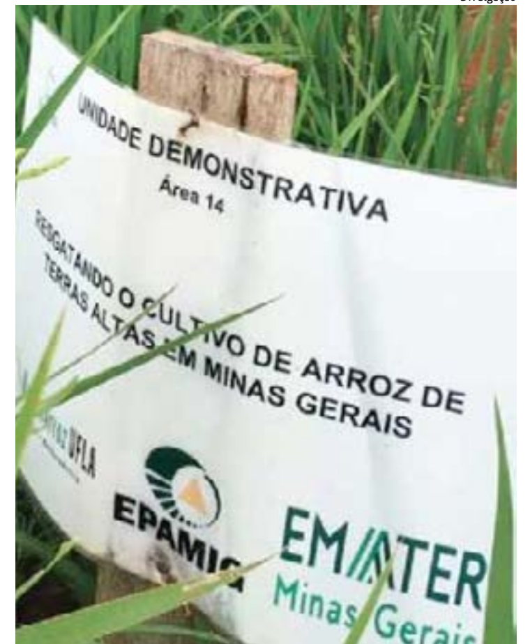
RUAS DAS LAVOURAS de cafés já estão tomadas pelos pés de arroz. Cereal deve ser colhido ainda neste mês