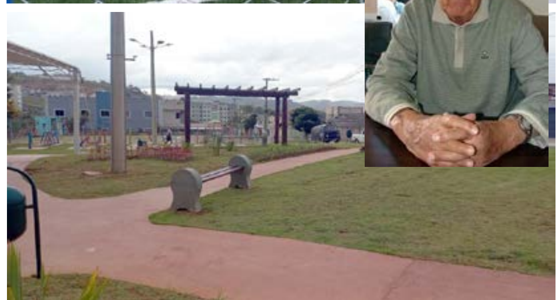
ESPAÇO fica localizado no bairro Santa Tereza

criou e apresentou programas que se tornaram referências na cobertura de eventos esportivos. Seus programas, como o “Difusora nos Esportes” e “Frente Esportiva Local”, foram fundamentais para a divulgação do esporte em Poços de Caldas e para a narração dos jogos da Caldense.