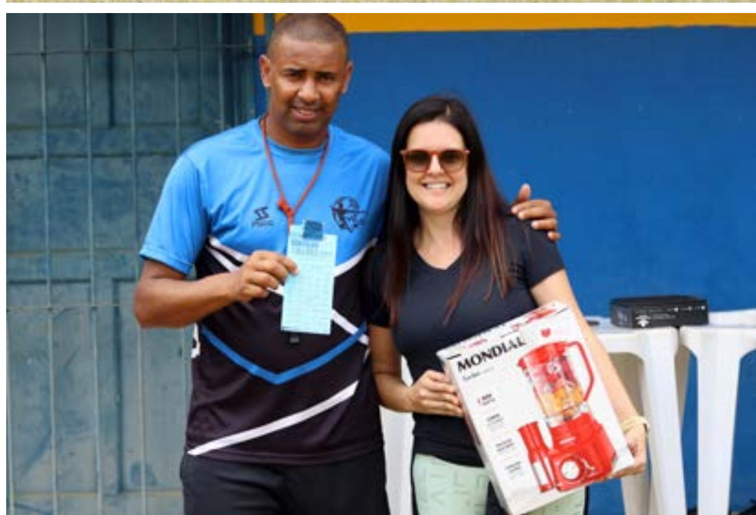
EVENTO foi realizado no último sábado no campo da CBA