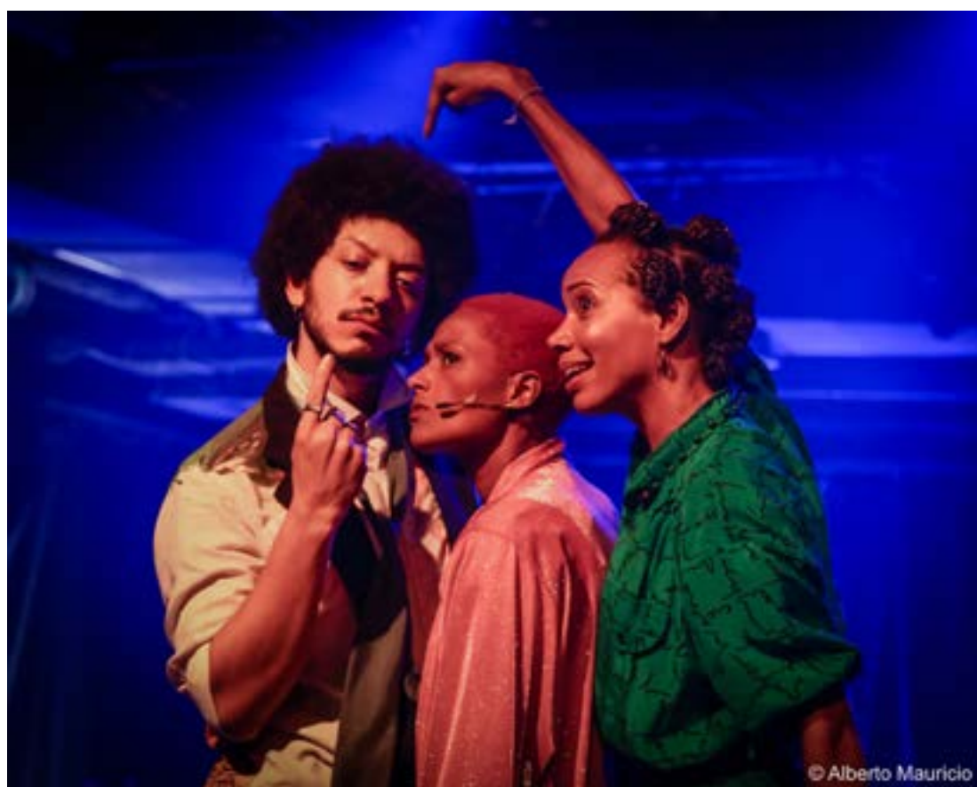
PROJETO já levou espetáculos de circo, teatro e dança para outras cinco cidades mineiras neste ano

Fundado pela Confederação Nacional do Comércio em 13 de setembro de 1946, o Sesc em Minas é uma instituição privada mantida pela contribuição sindical do empresariado do comércio. Por isso, embora as atividades sejam destinadas a toda a população, os trabalhadores e as trabalhadoras do comércio de bens, serviços e turismo, incluindo dependentes, são o público prioritário das ações e têm direito a descontos especiais. Em Minas Gerais, o Sesc atua em todas as regiões do estado, com