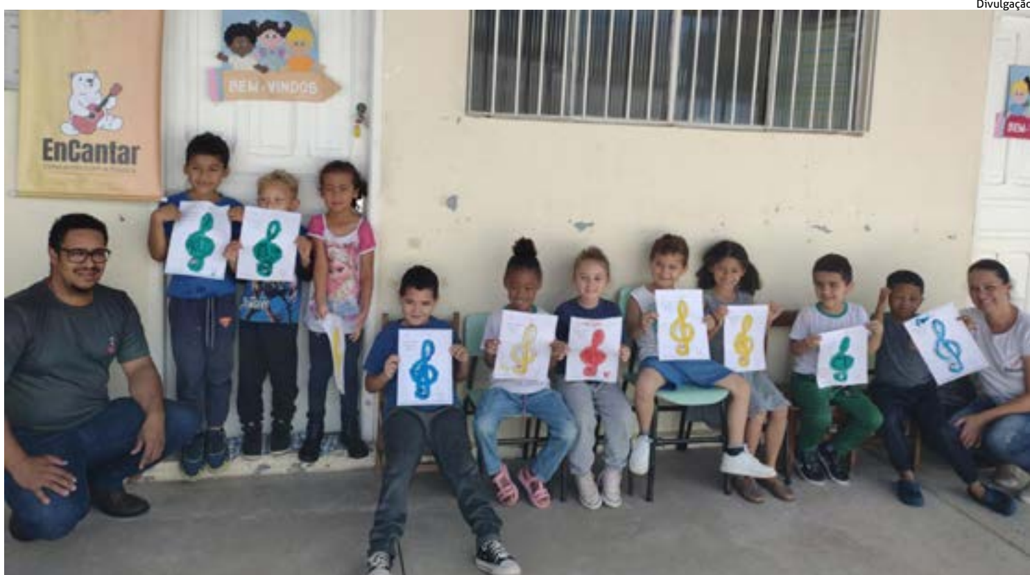
ENCANTAR foi idealizado com o propósito de democratizar o acesso à cultura, especialmente para crianças que não tem esse acesso