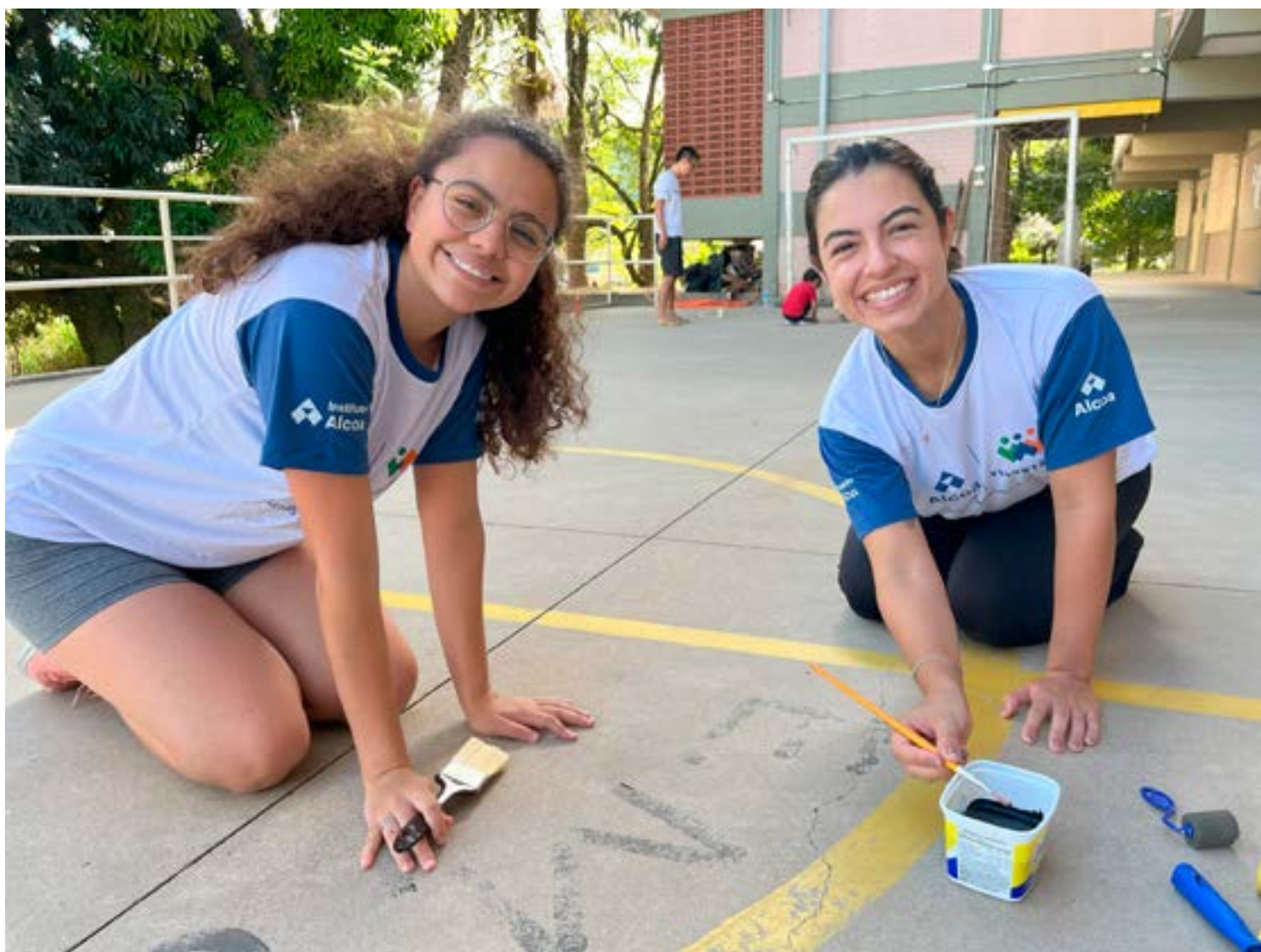
Pintura de jogos no pátio da escola, uma das atividades realizadas pelos voluntários