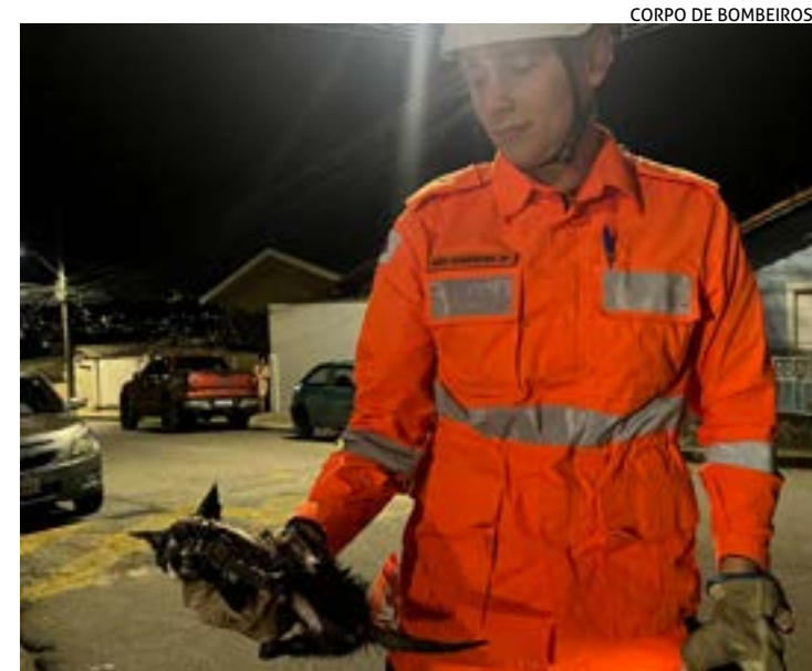
CORPO DE BOMBEIROS